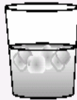
1 onza (30 ml) de licor