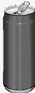
12 onzas (360 ml) de cerveza en lata con el 5% de alcohol