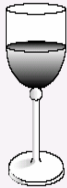
1 vaso de vino